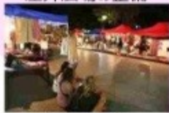
ナイトマーケット