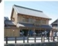
歴史的な町並みの景観に配慮した建造物