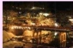
町並みのライトアップ