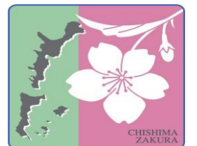
北方領土返還要求運動の シンボルの花「千島桜」

毎年8月を北方領土返還要求運動強調月間として、全道各地で署名 やパネル展など返還要求運動に係る催しが開催されています。本 町においても、8月1日から31日までの期間、健康福祉総合センタ ー1階ラウンジにおいて署名コーナーを設置しますので、町民の皆さ んのご協力をお願いします。