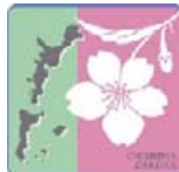
北方領土返還要求運動のシンボルの花「千島桜」

本町でも、期間中、健康福祉総合センター「ふれあい」1階ラウンジ・暮らしの安心センターにて北方領土返還要求の署名コーナーを設置しますので、署名にご協力くださいますようお願いいたします。