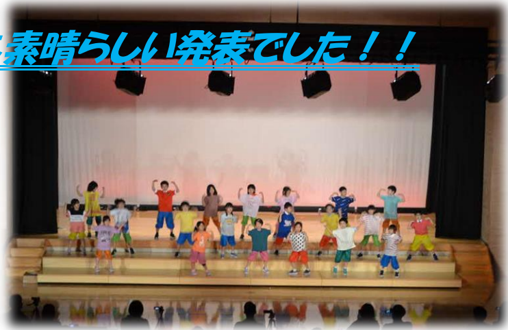
(1年生～沼田学園天国！)