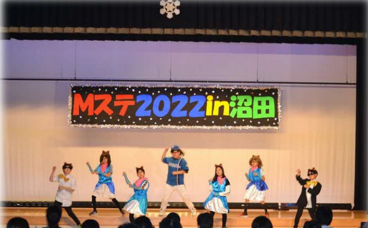
(5年生～Mステ 2022in 沼田)