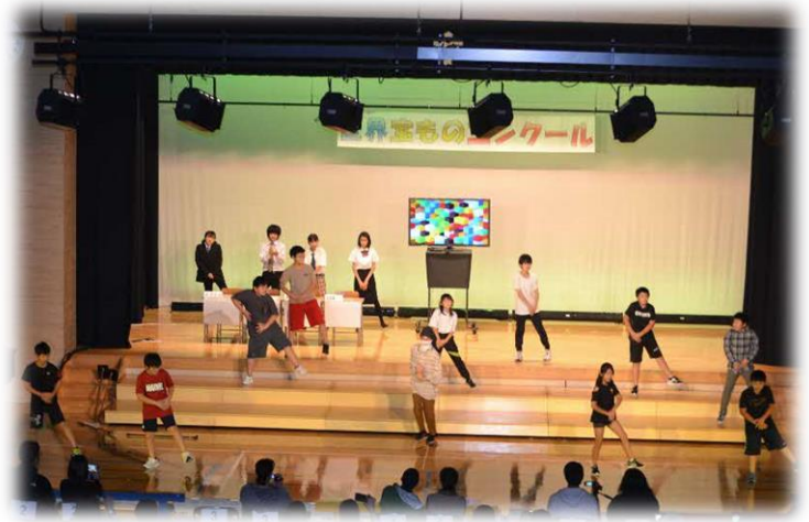
(6年～ほんとうの宝ものは)