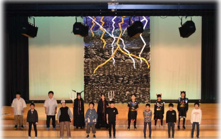
(4年生～魔界とぼくらの愛戦争)