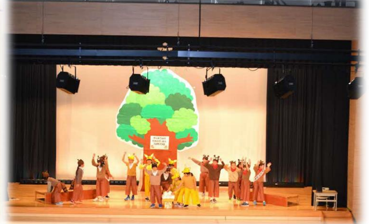
(2年生～ぼんぼこ山のたぬきときつね)