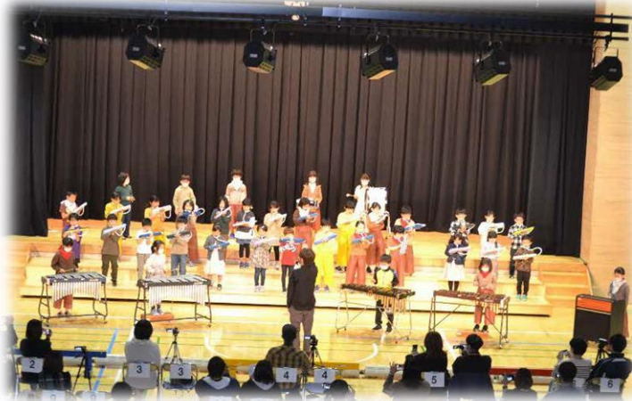
(1・2年生～マルマル・モリモリ他)