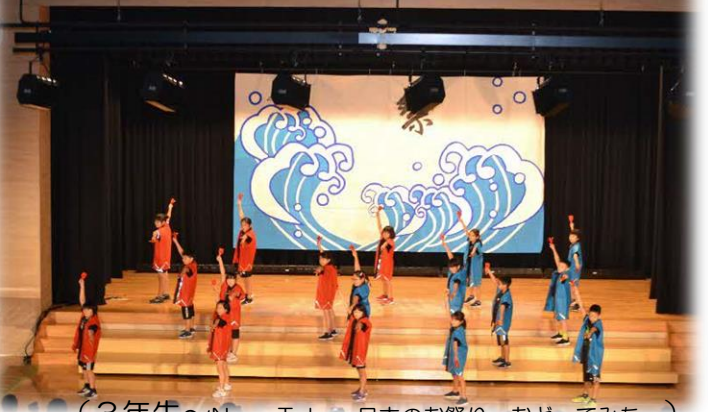
(3年生～NumaTube～日本のお祭り おどってみた～)