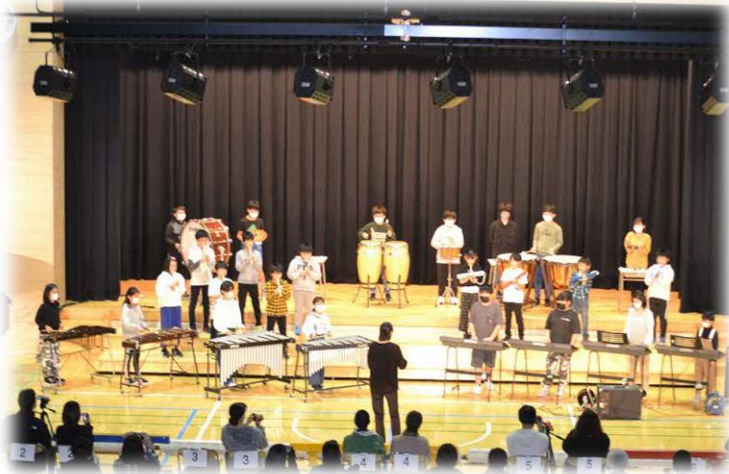
(5・6年～アフリカンシンフォニー 他)