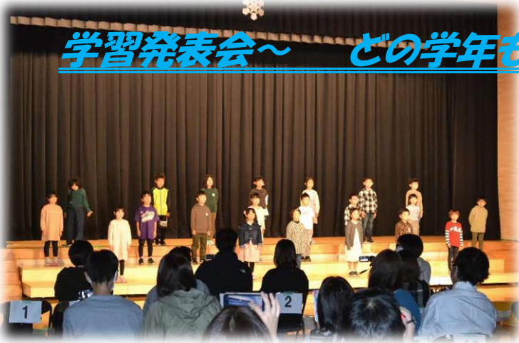
(1年生～はじめの言葉)