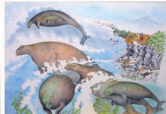
浩而魅諭 <カイギュウ>