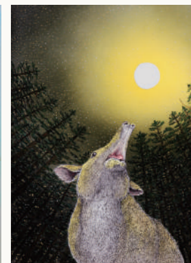
浩而魅諭 <プレシオコロピルス>