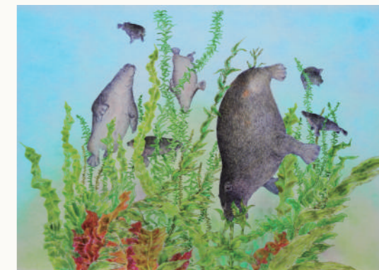
浩而魅諭 <デスマスチルス>

7月27日(土)実施の絵画ワークショップ、およびトークイベントは事前予約が必要です。ご予約は、沼田町化石体験館の受付窓口、またはお電話にて承ります。 募集期間 / 7月5日(金)～7月25日(木) 電話番号 / 沼田町教育委員会：0164-35-2132 (月曜日 9:00～17:00、平日 15:30～17:00) 沼田町化石体験館：0164-35-1029 (火～日曜日 9:30～15:30)