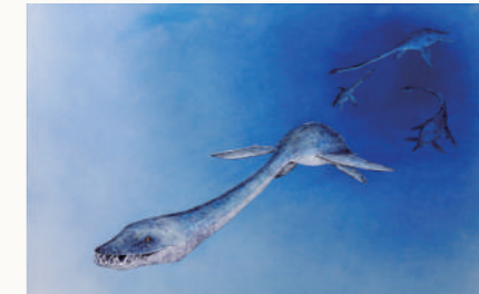
浩而魅諭 <ホベツアラキリュウ>