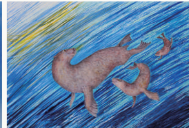
浩而魅諭 <アロデスムス>