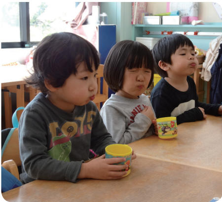
▲沼田保育園フッ化物洗口の様子

歯は、生えてから2～3年が最もむし歯になりやすいため、永久歯に生えかわる時期に適切なむし歯予防を行うことが大切です。