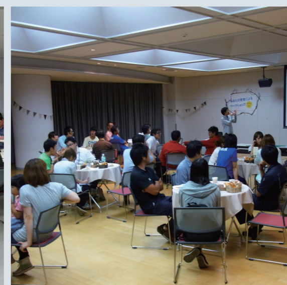
▲若者によるワークショップ（2回開催）