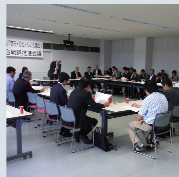
▲沼田町まち・ひと・しごと総合戦略推進会議（3回開催）

これらの目標を達成するためには、行政だけではなく町民皆さんのお力添えも必要となりますので、移住希望を持つ知友人等への魅力発信や人口維持・確保につながる情報の提供等、様々なかたちでのご協力をお願いします。