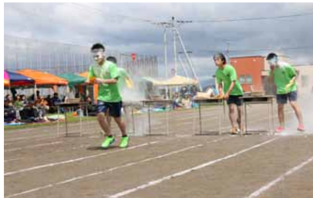
▲中学生生活最後の3年生、小麦粉の入った洗面器を頭から被るパフォーマンスで会場を沸かせました。