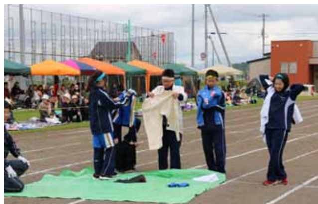
▲中1による「部活動！新入部員は大忙し」。