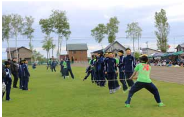
▲何回跳べるかな？中学生全員での「みんなでジャンプ」。

合同競技では恒例となった「デカパンリレー」や今年初めての競技となった「とんとんトンネル」では、仲良く息のあった競技を行いました。また、小学生競技の準備に中学生がお手伝いするなど協力しながら、元気いっぱいそれぞれの競技が行われました。