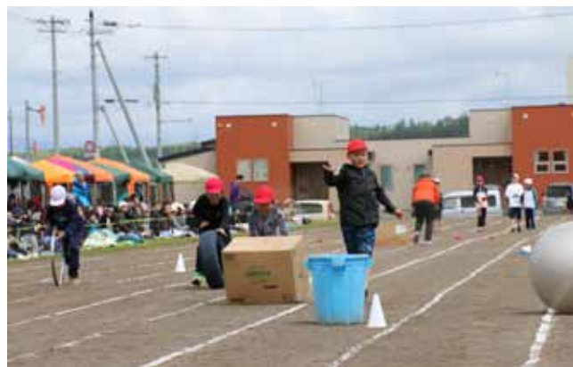
▲小3・4の「コロコロガーレ」四角い段ボールも転がします。