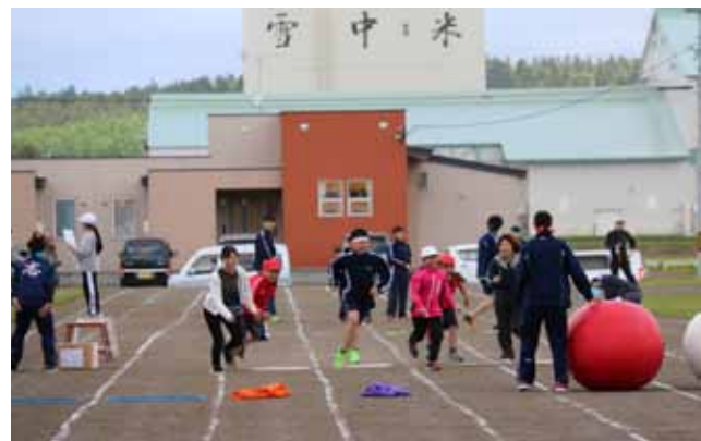
▲小5・6の「レンタマン・2018」では父兄も参加しました。