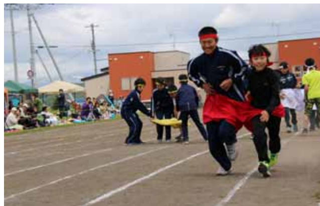
▲今年も健在！合同競技の「デカパンリレー」。