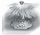
スプリンクラー設備