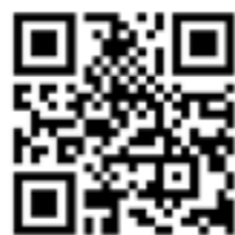
沼田町の土地住宅 QRコード