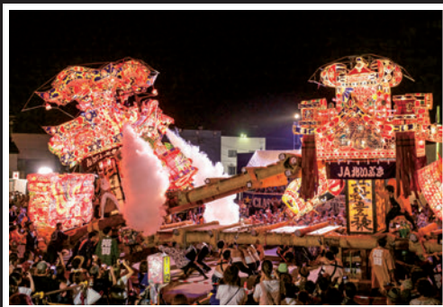
激突の時 (今井 昌 様/札幌市)