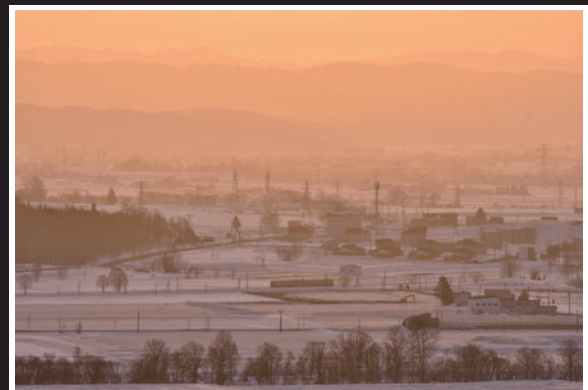
ありがとう留萌本線部門 夜明け (池端 清美 様 / 留萌市)