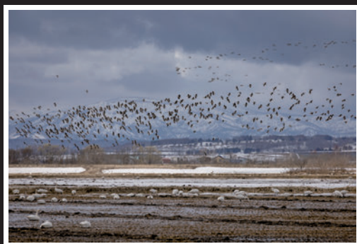
春の集い (龍川 悠平/留萌市)