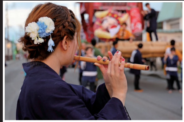
祭りを奏でる女(ひと) (増井 道英 様 / 苫小牧市)