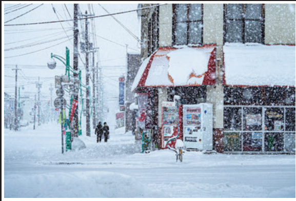
雪と共に (眞鍋 真弓 様 / 深川市)