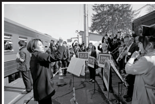
ありがとう留萌本線部門 惜別の情に別涙、沼田吹ガールズ