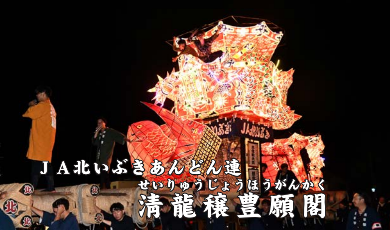
J A北いぶきあんどん連 せいりゅうじょうほうがんかく 清龍穰豊願閣