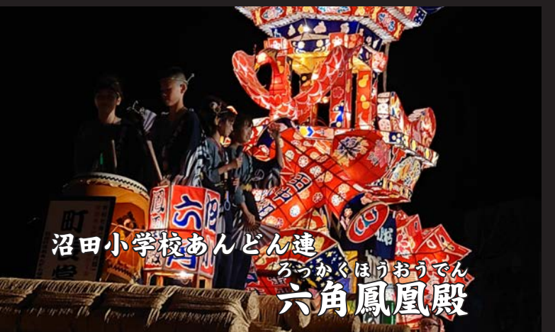
沼田小学校あんどん連 ろっかくほうおうでん 六角鳳凰殿