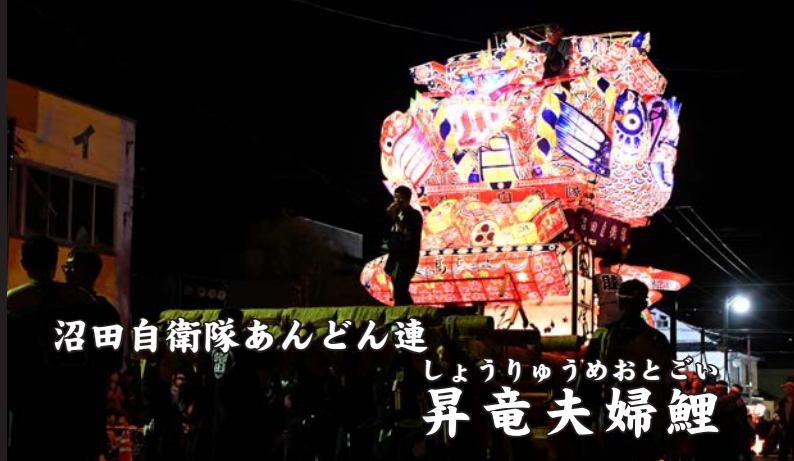
沼田自衛隊あんどん連 しょうりゅうめおとごい 昇竜夫婦鯉