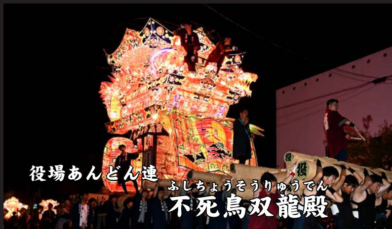
役場あんどん連 ふしちょうそうりゅうでん 不死鳥双龍殿