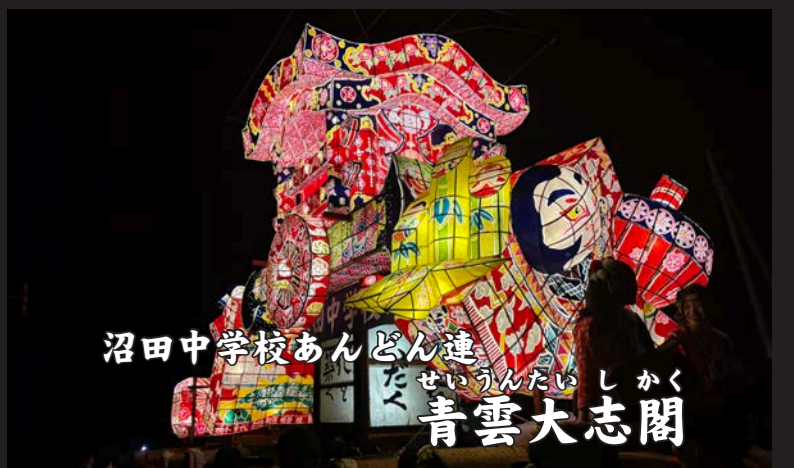
沼田中学校あんどん連 せいうんたいしかく 青雲大志閣