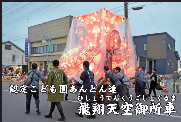
認定こども園あんどん連 ひしょうてんくうごしよぐるま 飛翔天空御所車