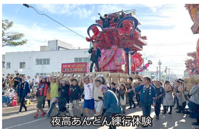
夜高あんどん練行体験