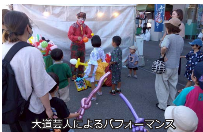
大道芸人によるパフォーマンス