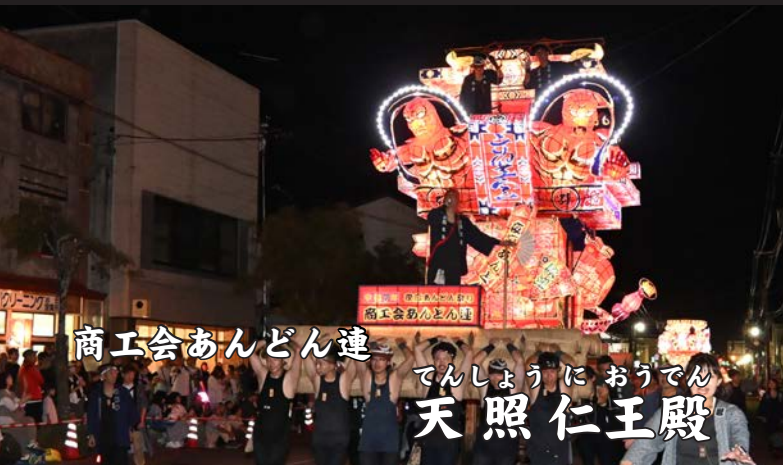
商工会あんどん連 てんしょうにおうでん 天照仁王殿