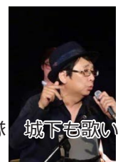
協力隊 城下も歌います！