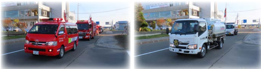
令和6年防火パレードの様子