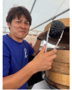
▲夜高あんどん祭りでも奮闘中！