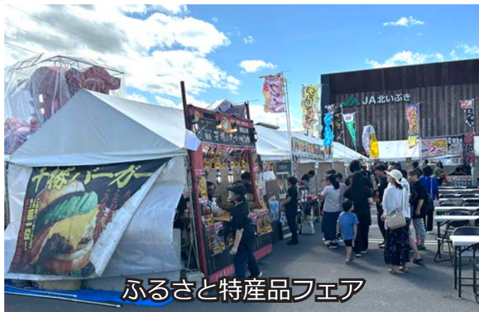
ふるさと特産品フェア