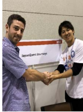
▲インバウンドのツアー商談もしていました

「まちづくり沼田」に所属し、いつもは“まちなかほっとタウン”でふるさと納税品のプロモートやお祭り・イベントでは幻の沼田黒毛和牛まん等を販売しています。