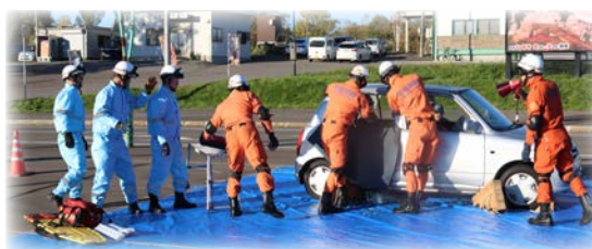
車両救出訓練の様子