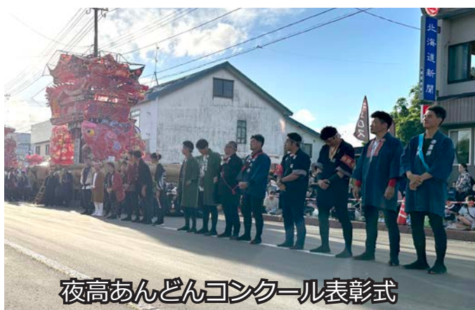
夜高あんどんコンクール表彰式