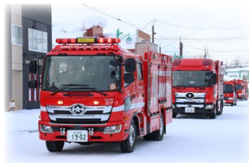
▲令和7年出初式の様子