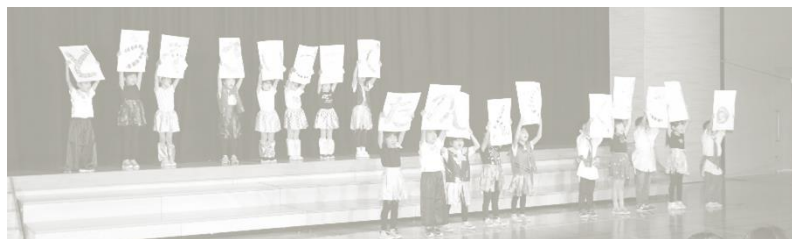
はじめての学習発表会 1年生のはじめの言葉の様子

健やかに育つ「沼田っ子」たちが、今後一層、その力を発揮していくためには、保護者と