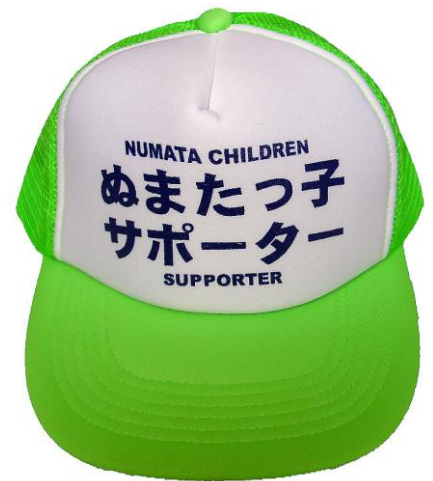
この帽子をかぶれば子どもたちも安心！

また、子どもたちには「緑色の帽子を着用している人は、皆さんを守ってくれるサポーター（応援団）です。声をかけられたら元気にあいさつしましょう」と指導しています。ですから、帽子は大事に保管し、絶対に他人へ譲渡しないでください。なお、転出や会員を脱退する場合等は必ず教育委員会に返却するようお願いします。