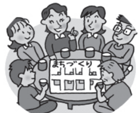
隣近所の協力体制