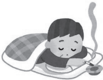
寝たばこはしない