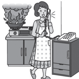
ガスコンロから離れない