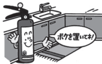
住宅用消火器の設置