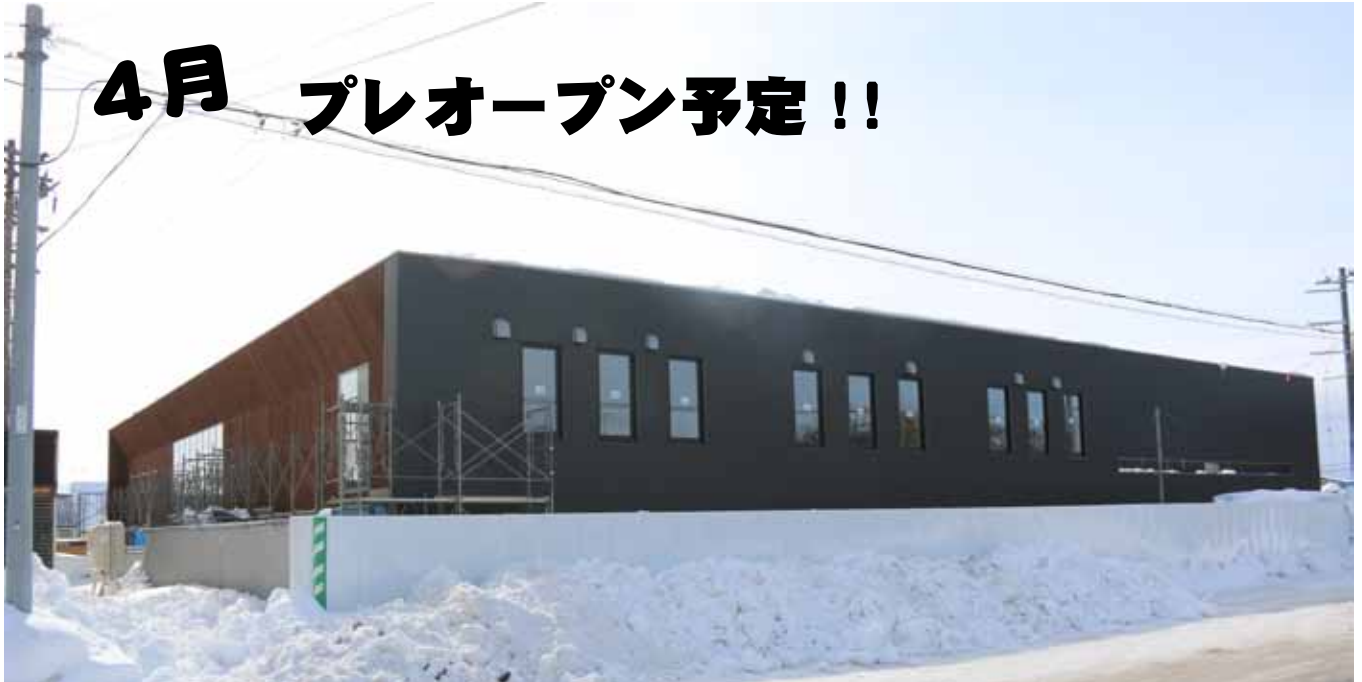
▲道道達布石狩沼田停車場線側より撮影