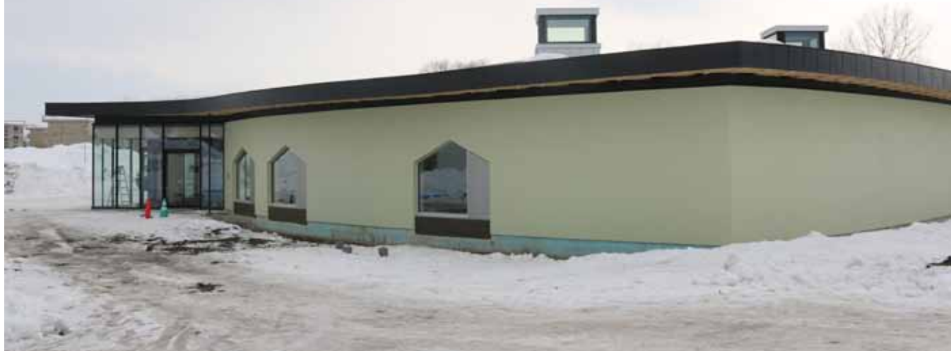
▲旧中学校グランド側から撮影