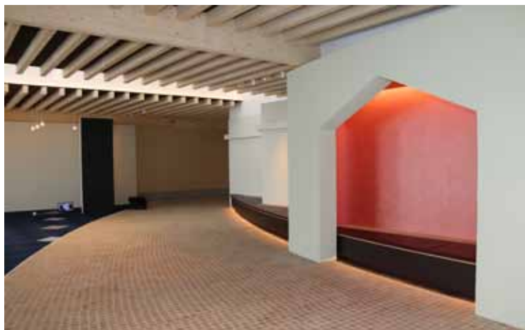
▲開放感あふれる「なかみち」

昨年7月から工事していました「暮らしの安心センター」は、診療所側となる第1期工事が2月中に完成し、医療機器や備品などが搬入されます。その後、雪解けを待って5月から外構工事が始められ、7月上旬に新しい「町立診療所」(沼田厚生クリニック)としてオープンする予定です。町立の診療所として「防ぐ(予防)」、「支える(在宅医療)」をコンセプトに町民の暮らしに寄り添う診療所を目指します。 また、南側部分となる「あんしんセンター」、運動器具など皆さんが気軽に利用できる施設も備えた「デイサービスセンター」側の第2期工事は、8月に完成、10月中には全館グランドオープンする予定となっております。完成後は介護等の総合相談窓口(ラウンジ)などが設けられ、地域医療・福祉・介護・健康づくりの拠点として全世代が気軽に集まれる施設となります。