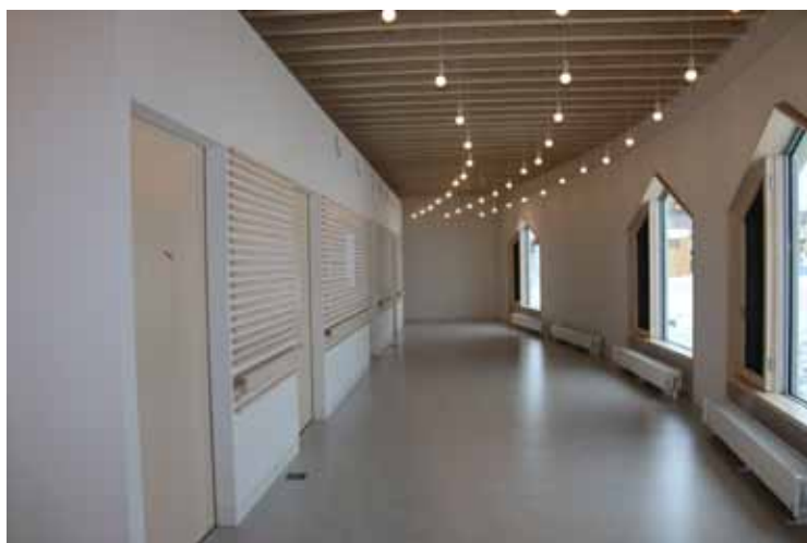
▲診療所の待合ホール