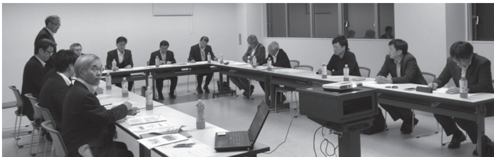
今年度3回(9,11,12月)の準備委員会を開催

小中一貫・連携教育とコミュニティ・スクールは、新しい教育の「両輪」と言われ、沼田町の教育は、31年度からゆるやかにコミュニティ・スクール化をめざしています。