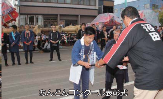
あんどんコンクール表彰式