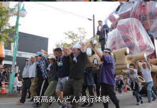
夜高あんどん練行体験