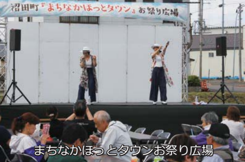
まちなかほっとタウンお祭り広場