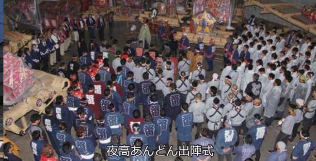
夜高あんどん出陣式