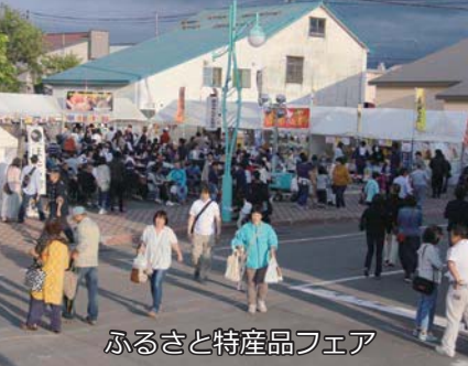
ふるさと特産品フェア