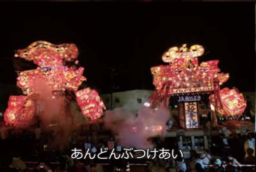
あんどんぶつけあい