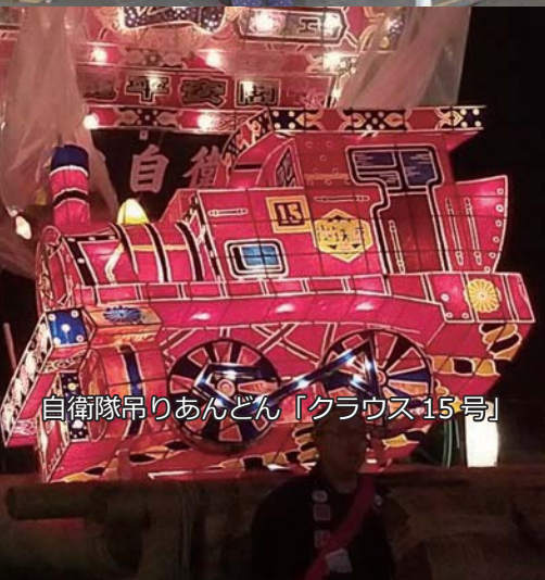
自衛隊吊りあんどん「クラウド15号」