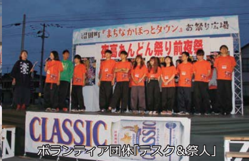
ボランティア団体「デスク&祭人」