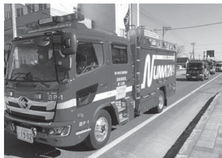
※写真は昨年度春の火災予防運動の様子