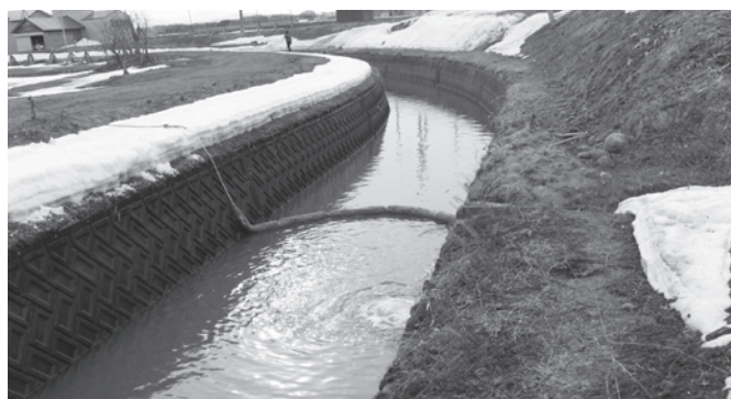
▲オイルフェンスによる流出拡大防止措置

油流出事故を起こさないため今一度、ホームタンク配管や車両燃料キャップ等の確認をお願いします。