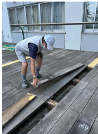
和風園「屋外ステージ修繕」