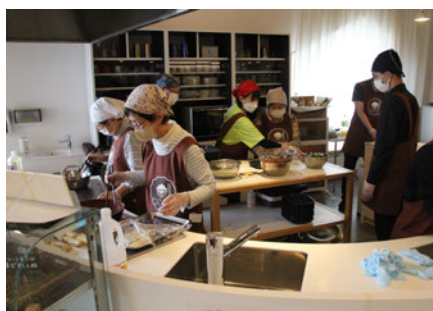
社会福祉協議会「みんなの食堂」