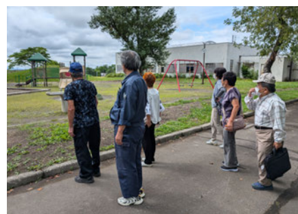
登録者で町内視察 「私ができること探し」