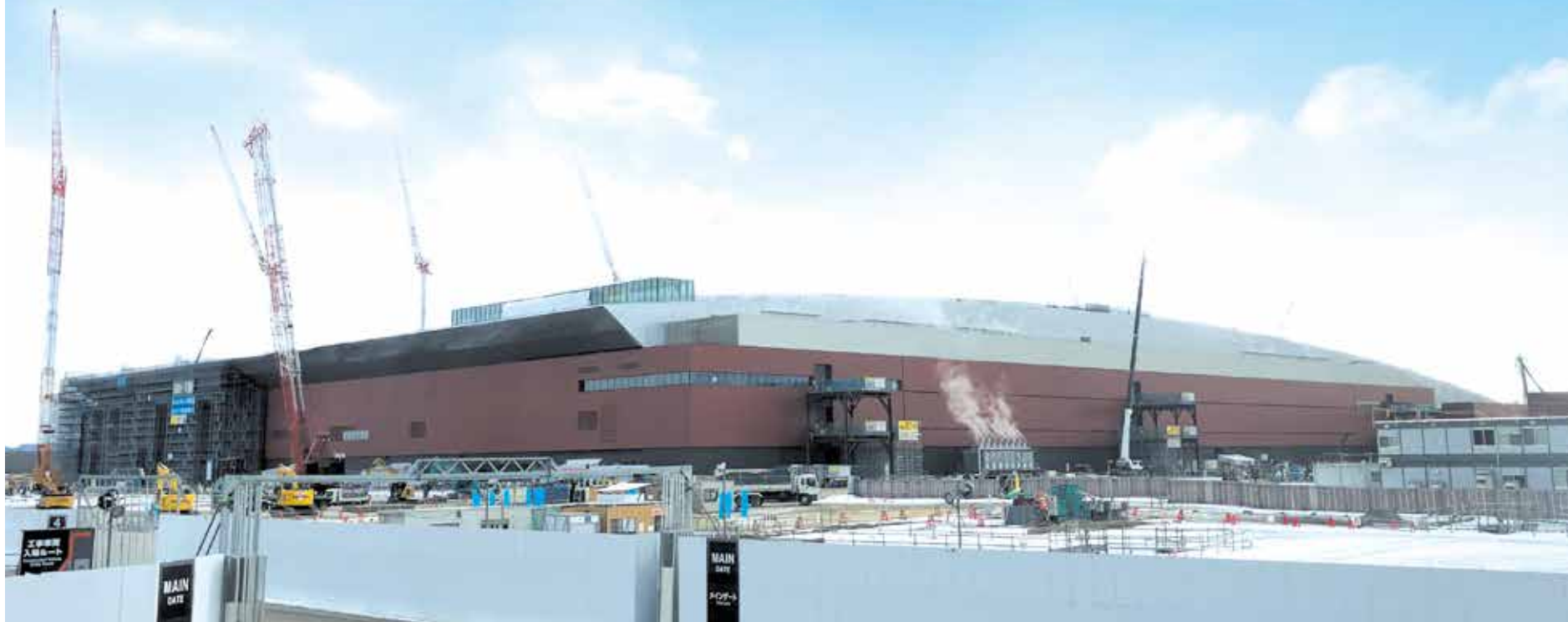
建設中のRapidus株式会社の工場

次世代半導体の量産製造を目指すRapidus株式会社(以下、ラピダス社)が、千歳市への製造拠点立地を表明してからもうすぐ2年。ラピダス社の立地を契機として、道内では、さまざまな取り組みが進められています。