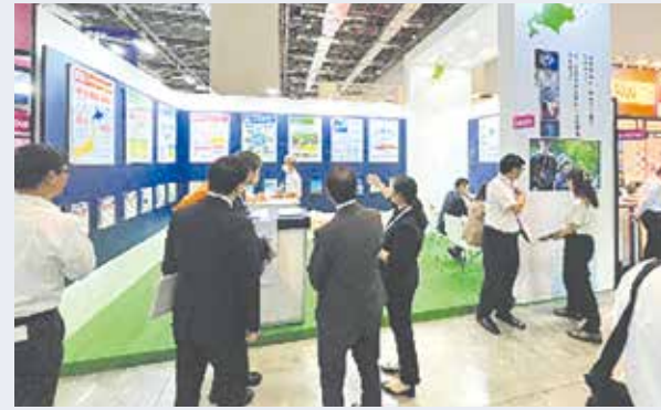
展示会の様子(セミコン台湾)

セミコンジャパン、セミコン台湾など道外・海外で開催される半導体の国際展示会に出展し、道の立地環境の優位性などをPRしています。