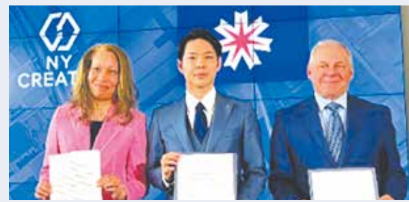
ニューヨーク州経済開発公社及びニューヨーク・クリエイツとの覚書締結の様子

令和6年8月、産学官連携による半導体の研究開発の先進地であるニューヨークを訪問し、ニューヨーク州経済開発公社及びニューヨーク・クリエイツとの三者で覚書(MOU)を締結し、半導体の研究開発や人材育成等での連携に関する枠組みを構築しました。